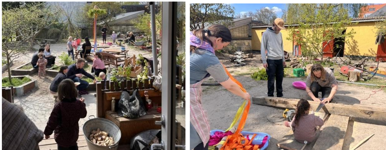
Billede fra arbejdslørdag og majfest i børnehaven for børn og forældre.