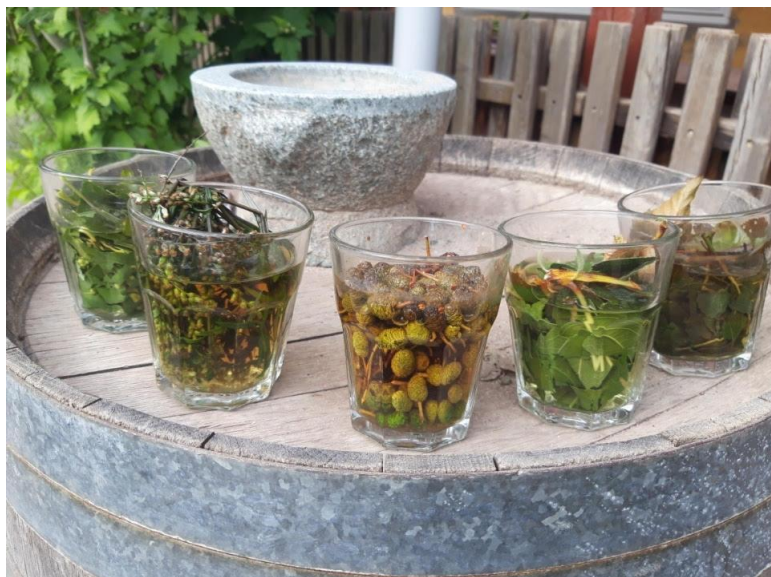
Billede fra naturfund i børnehavens have.